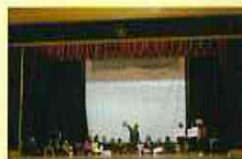
【子どもたちの発表の様子】