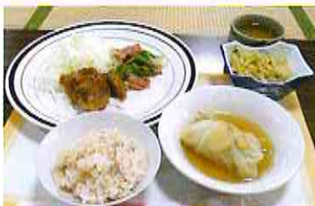
湊地区社協で作られたメニューの紹介

今回は、湊地区社協主催でおこなわれた、同教室のメニューの一部を紹介します。 みなさん是非、試してみてください。